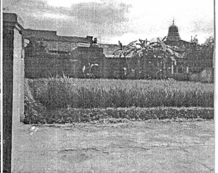
Lahan pasawahan mingkin ngaheureutan

kaasup pamaréntah, kudu nalingga-keun kahirupan patani. “Cindekna, pihak séjén kudu sieun upama teu mampuh ngaraharjakeun patani,” pokna tandes naker.