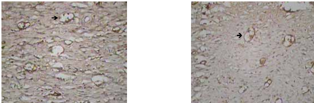
Gambar 2 Hasil Pengamatan Imunoekspresi CD34 Hari ke-14 (Pembesaran 400x)

Kiri: Kontrol; Kanan: Perlakuan. Pada kelompok perlakuan sel inflamasi (tanda panah) sudah lebih berkurang dibandingkan dengan kelompok kontrol